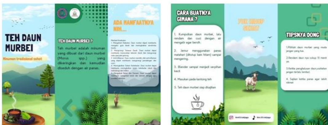
Gambar 3. Flyer/Brosur Tentang Teh Daun Murbei

Kegiatan penyampaian informasi terkait daun murbei juga dilakukan dengan memberikan flyer tentang kebermanfaatannya. Informasi yang diharapkan sampai kepada pembaca berupa cara membuat teh dari daun murbei, kemanfaatan penggunaan teh murbei serta tips yang dapat digunakan dalam pemanfaatannya. Adapun flyer dapat dilihat pada gambar 3.