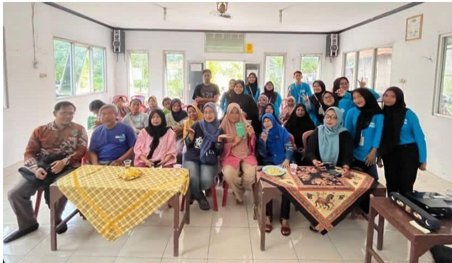
Gambar 2. Audiens dan masyarakat yang hadir dalam kegiatan

dimulai dengan menjelaskan sumber, jenis dan identifikasi daun murbei, kandungan serta kebermanfaatannya secara tradisional maupun secara riset. Antusiasme masyarakat dapat terlihat dari banyaknya pertanyaan yang muncul serta hadirnya berbagai kalangan warga dari usia muda sampai lansia Kegiatan yang dilakukan dihadiri oleh masyarakat dalam juga terdapat perwakilan RT dan RW yang dapat dilihat pada gambar 2.