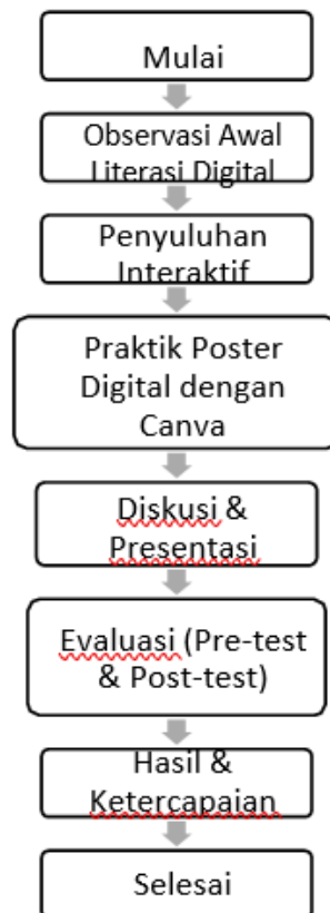
Gambar 1. Alur Kegiatan Penyuluhan Keamanan Digital dan Etika Bermedia Sosial